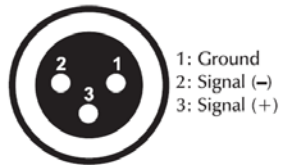
DMX-output XLR mounting-socket: